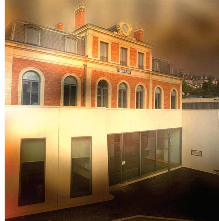
MUSÉE D'HISTOIRE URBAINE ET SOCIALE DE SURESNES

Direction de la communication - Décembre 2013 - Photos : Ville de Suresnes - MUS