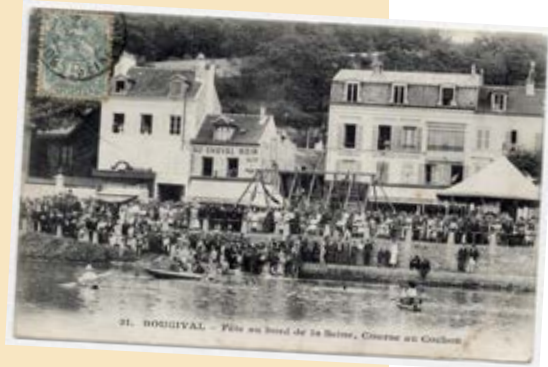
Fête au bord de la Seine à Bougival - Course au cochon à Bougival Carte postale XX e siècle Archives départementales des Yvelines, Montigny-le-Bretonneux, côte 3 Fi 3515

Découvrez les fonds considérables de cartes postales consacrées à la Seine et conservées dans les collections du MUS.