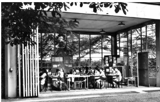
Classe ouverte sur l'extérieur

L' école de plein air naît au tout début du 20 e siècle. Sa création est due surtout au développement croissant de la tuberculose et au manque d'hygiène. Ces deux facteurs ont pour conséquence une mortalité, surtout infantile, élevée. De nouveaux types d'établissements scolaires sont préconisés pour les enfants dits « pré-tuberculeux » et chétifs dans lesquels un programme éducatif et médical préventif adapté leur sera proposé.