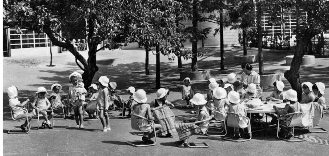
activités de l'après-midi. classe de travaux ménagers

Ils retournent dans leur classe pour les activités de l'après-midi qui se terminent par des cours de dessin , de gymnastique , de musique ou d' enseignement ménager .