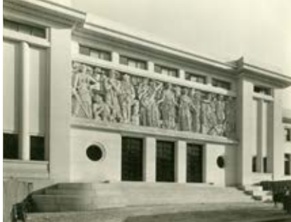
Hôtel de ville de Puteaux

Dans le cadre de l'exposition « Trésors de décors, façades d'Île-de-France », le MUS vous propose de découvrir les façades ornées de Suresnes. En observant bien les immeubles et les équipements publics, vous pourrez apercevoir des détails d'ornement insoupçonnés.