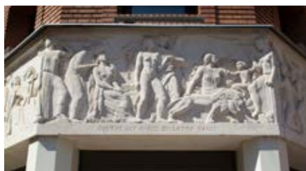
Bas-reliefs du théâtre de Suresnes Jean-Vilar