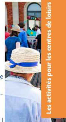
Les activités pour les centres de loisirs